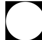
Tabelle und Spielplan